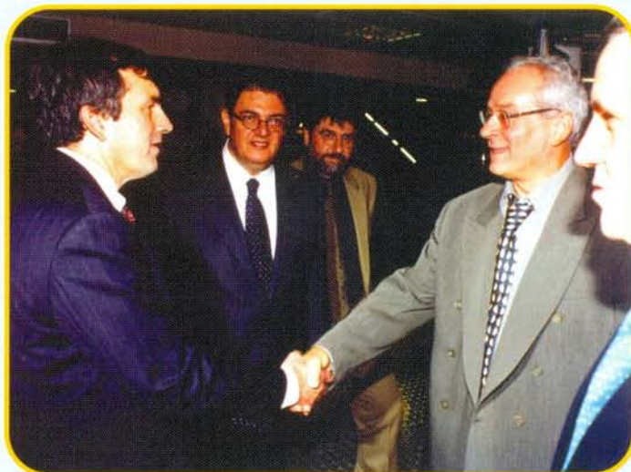
Στην Έκθεση EXPO COMM GREECE/BALKANS 2001, διακρίνονται από αριστερά προς τα δεξιά ο κ. Thomas Miller, Πρεσβευτής των Η.Π.Α., ο κ. Χρ. Βερελής, Υπουργός Μεταφορών και Επικοινωνιών και ο κ. Ν. Πιπιτσούλης, Πρόεδρος της ΜΑΡΑΚ.

Στη μεγάλη έκθεση Τηλεπικοινωνιών που έγινε στο Διεθνές Εκθεσιακό Κέντρο HELEXPO, στο Μαρούσι, από 9 έως 11 Νοεμβρίου, συμμετείχε με σειρά προϊόντων υψηλής τεχνολογίας η ΜΑΡΑΚ ΗΛΕΚΤΡΟΝΙΚΗ Α.Β.Ε.Ε.. Η έκθεση EXPO COMM GREECE/BALKANS 2001 αποτέλεσε σημαντικό γεγονός προβολής της βιομηχανικής παραγωγής προϊόντων προηγμένης τεχνολογίας στη χώρα μας καθώς και της προώθησής τους στα Βαλκάνια. Η ΜΑΡΑΚ εξέθεσε όλα τα νέα προϊόντα των οίκων που αντιπροσωπεύει στην Ελλάδα καθώς και προϊόντα υψηλής τεχνολογίας και καινοτομικών εφαρμογών που προέρχονται από δική της έρευνα και κατασκευάζονται στο εργοστάσιο της στην Αλεξανδρούπολη. Μερικά από τα προϊόντα της ΜΑΡΑΚ στην έκθεση συνδέονται με την Ασύρματη Ίδιωτική Ψηφιακή Κινητή Τηλεφωνία DECT (KIRK, Δανίας), ISDN Τηλεφωνικές Συσκευές (KIRK, Δανίας), Συστήματα Μετρήσεως, Ελέγχου και Διαχείρισης Τηλ/κων Δικτύων (NETTEST, Δανίας), Συστήματα Ψηφιακής Πολυπλεξίας (ΜΑΡΑΚ), Συστήματα Τηλεμετρίας και Διαχείρισης Αυτόματης Ανάγνωσης Μετρητών (ΜΑΡΑΚ), Συστήματα Ασύρματης Επικοινωνίας (MAXON, Αγγλίας), Συστήματα Συγχρονισμού Τηλεπικοινωνιακών Δικτύων (SYMMETRICOM, ΗΠΑ), Αναλυτές Φάσματος (ADVANTEST, Ιαπωνίας).