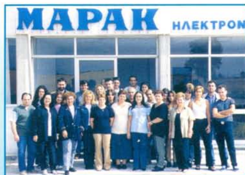
Το προσωπικό του Εργοστασίου της MAPAK στην Αλεξανδρούπολη