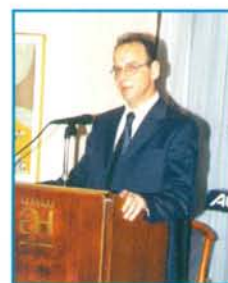
Ο Βουλευτής Έβρου κ. Νίκος Ζαμπουνίδης