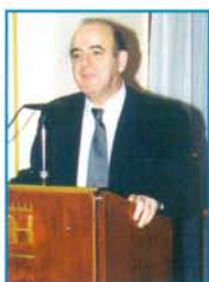
Ο Υφυπουργός Οικονομίας και Οικονομικών κ. Απόστολος Φωτιάδης