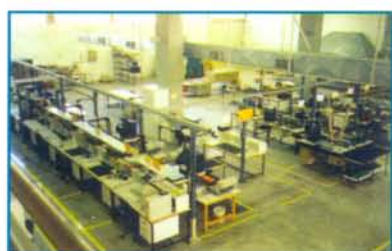
Μια εικόνα του υπερσύγχρονου τεχνολογικού εξοπλισμού του εργοστασίου

Η πανηγυρική εκδήλωση της εταιρίας στην Αλεξανδρούπολη συνοδεύτηκε από δυο ακόμη σημαντικές και ενδιαφέρουσες πρωτοβουλίες. Συγκεκριμένα την επόμενη μέρα πραγματοποιήθηκε επίσκεψη στους χώρους του εργοστασίου, από όλους τους φιλοξενούμενους, παρουσία των προϊσταμένων των τμημάτων και του προσωπικού της γραμματείας. Οι εντυπώσεις όλων μας ήταν άριστες. Πολύ καλή οργάνωση, σύγχρονα μηχανήματα, επεξηγηματικοί χάρτες των διαδικασιών, άνετοι χώροι εργασίας κ.ά.. Μια εντυπωσιακή πραγματικά εικόνα εργοστασίου προϊόντων υψηλής τεχνολογίας. Συχαρητήρια σ' όλους τους εργαζόμενους και ευχές για «καλές δουλειές»!