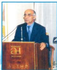
Ο Βουλευτής Έβρου κ. Θεοφάνης Δημοσάκης