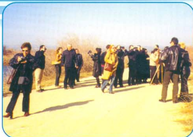
Στιγμιότυπο από την ξεναγήση στον υδροβιότοπο στο Δέλτα του ποταμού Έβρου