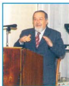
Ο Βουλευτής Έβρου κ. Λεωνίδας Λυμπερακίδης