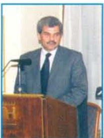
Ο Νομάρχης Έβρου κ. Γεώργιος Ντάλιος