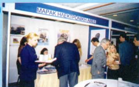
Από την κίνηση στο περίπτερο της ΜΑΡΑΚ