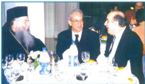
Ο Μητροπολίτης Αλεξανδρούπολης κ. Άνθιμος, ο Πρόεδρος της ΜΑΡΑΚ κ. Νίκος Πιπιτσούλης και ο Υφυπουργός κ. Απόστολος Φωτιάδης